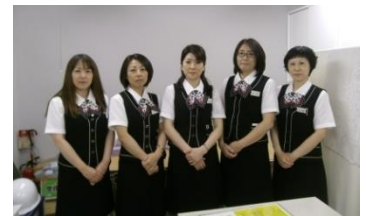
【 来客準備室の従業員5名 】

当社では、他の地区の来客準備室業務も含めまして、お客様に快くお過ごし頂くためにサービス提供を図って参ります。