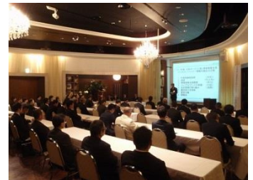
【 情報交換会の様子 】

本会では、2016年度において当社の環境事業に特にご協力いただきました、日立セメント(株)殿に感謝の意を表し、感謝状と記念品を贈呈させていただきました。また、説明報告会終了後の懇親会では、各取引先企業の皆さまと有意義な情報交換が行われ、顧客サービス向上へ向けた一層の連携強化を誓い合いました。