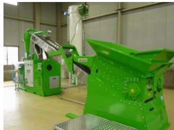
【 廃電線ナゲット機 】

ナゲット機とは、電線を細かく粉砕し、銅と被覆を機械的に仕分けする装置です。主な特徴は、粗破砕機と本体を組み合せ、自動制御することにより、多品種の電線を同時に大量投入することが可能です。振動・比重・送風を利用して採取した銅は、異物の混じりが少なく高品位なりサイクル原料となります。