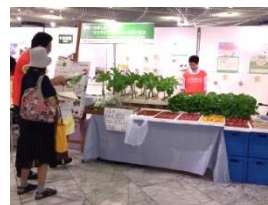
【 当社展示ブースの様子 】

※ ナノバブル水：直径が1μm(マイクロメートル)未満の泡が滞留する水。さまざまな特性を持つ機能水として期待されている。