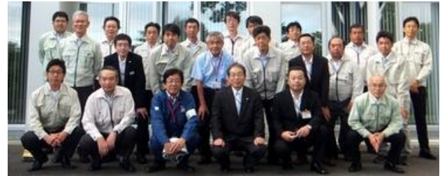
【 情報交換会 参加メンバー 】