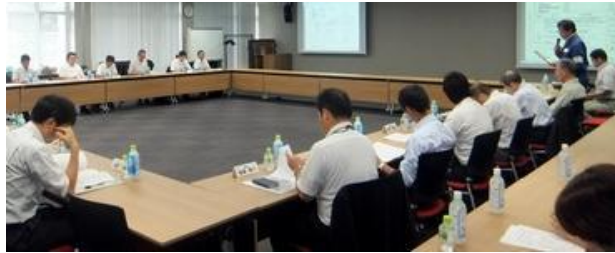
【 情報交換会の様子 】

※ FRP：繊維強化プラスチックの事で、ガラス繊維などの繊維をプラスチックの中に入れ、強度を向上させた複合材料のこと。