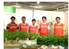
【 展示ブース担当メンバー 】