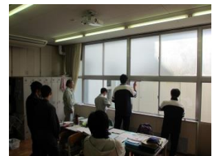
【 清掃作業の講義と実習の様子 】