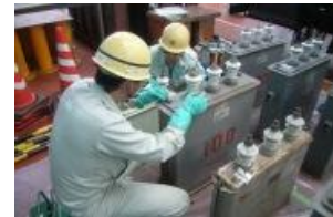
【 PCB廃棄物の処理作業 】