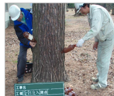
【松の薬剤樹幹注入】