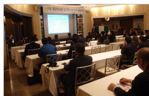
【情報交換会の様子】

当社の環境事業に、特にご協力いただいた3社に感謝状と記念品を贈らせていただいたほか、有意義な情報交換を行い顧客サービス向上へ一層の協力を誓い合いました。