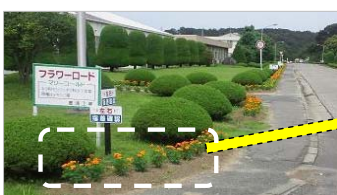
【6月に植栽したマリゴールド】

6月と11月に正門メイン通りに花苗を植栽するもので、当社が施肥や苗等を準備し、従業員の方々が植栽されました。ご来場の際は、是非ご覧下さい。