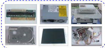
【解体・分別された部品(一部)】