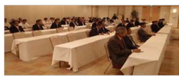
【情報交換会の様子】

クレンリーアート(株)様 (株)セイコーインターナショナル様 協業組合日立環境開発センター様 滑川緑化様 以上、計4社