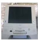
【解体前のパソコン】

福祉リサイクルセンターで解体したパソコン等を資源別に分別したものや、観葉植物等を展示予定です。皆様のご来場をお待ちしております。