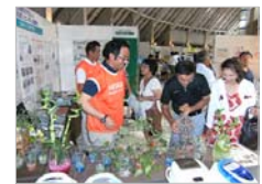
【展示ブースの様子】