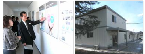
【内覧会の様子】 【施設外観】

従来のパソコンやOA機器類の処分に加え、4月から国のリサイクル制度制定にさきがけ、日立市から委託を受けて小型電子機器の受け入れ実証試験を開始しました。施設は、バリアフリー・車椅子対応トイレ・LED照明を設置しています。見学も随時可能ですので、お気軽にお問い合わせ下さい。