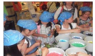
【ミニ観葉植物づくり】